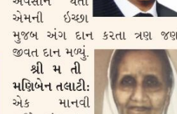
કરતા ત્રણ જણને